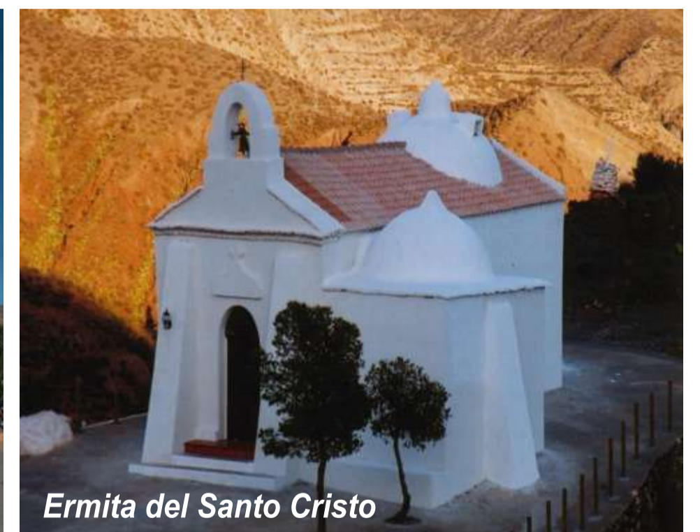
Ermita del Santo Cristo