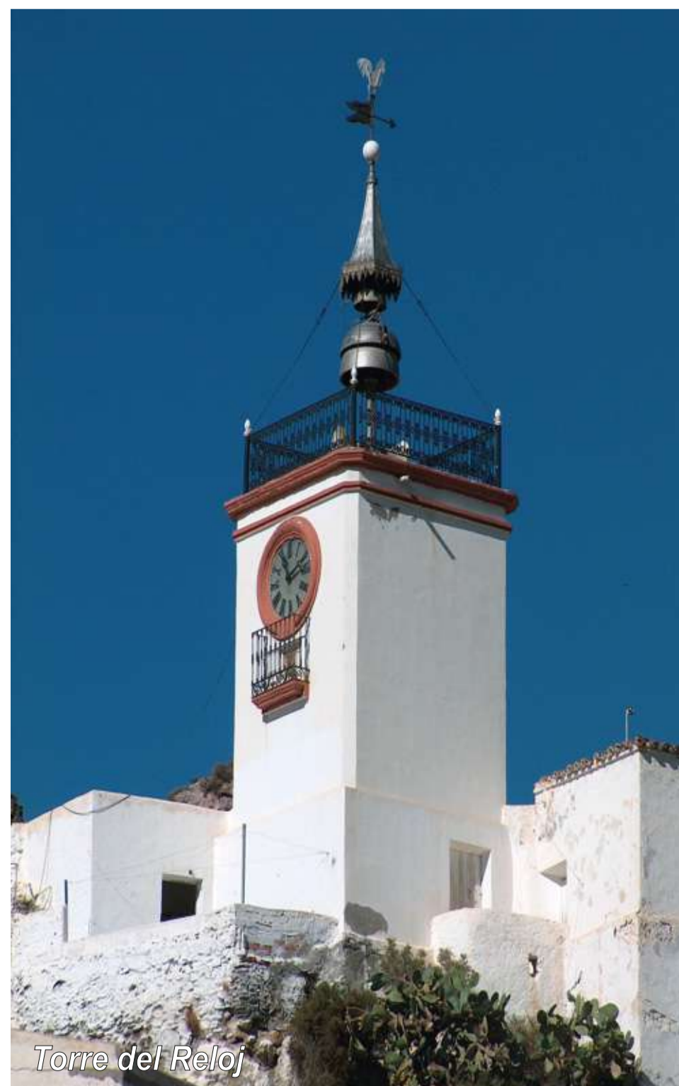
Torre del Reloj