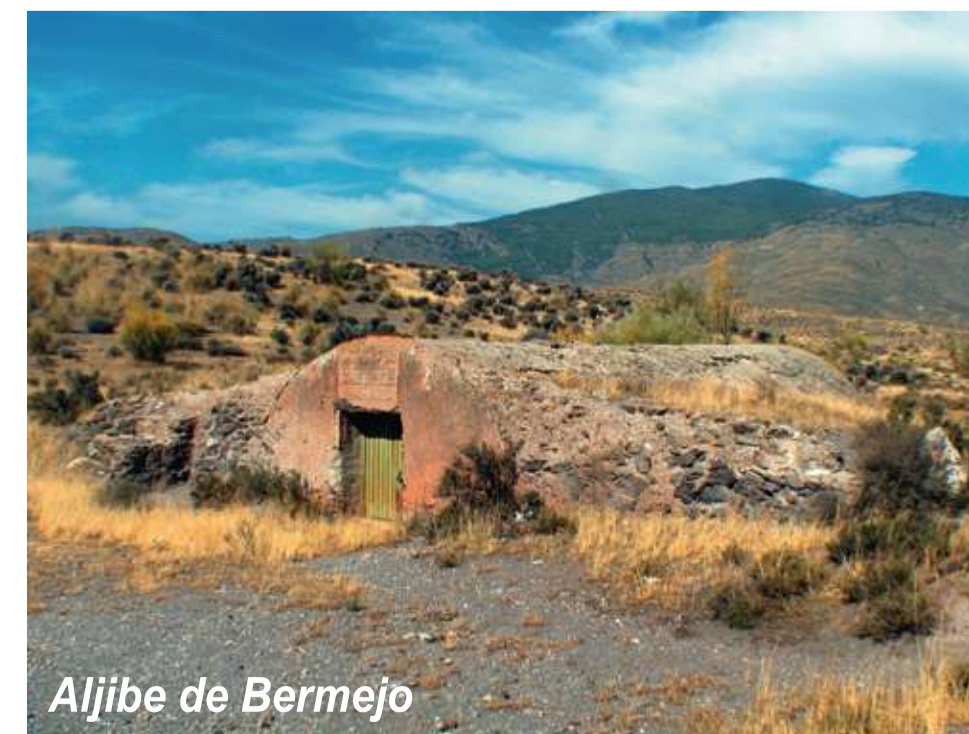
Aljibe de Bermejo