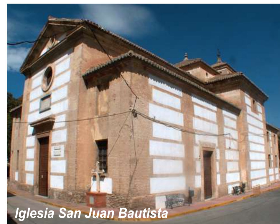
Iglesia San Juan Bautista